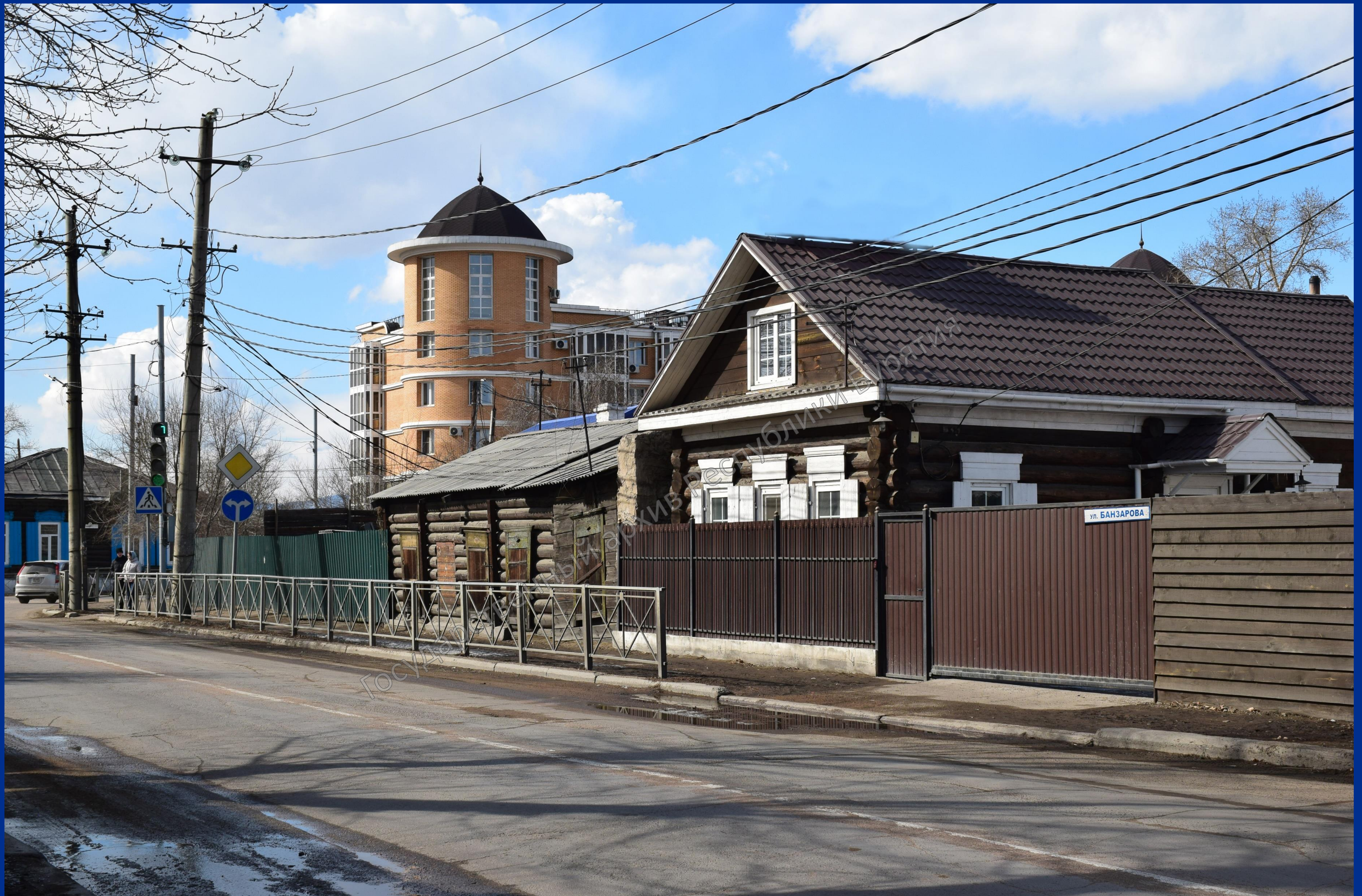
Улица имени Доржи Банзарова. г. Улан-Удэ. 2022 г.